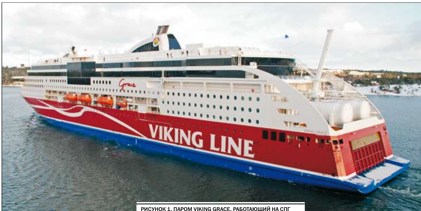
РИСУНОК 1. ПАРОМ VIKING GRACE, РАБОТАЮЩИЙ НА СПГ

кernые компании сформировали три основных варианта решения данной проблемы: