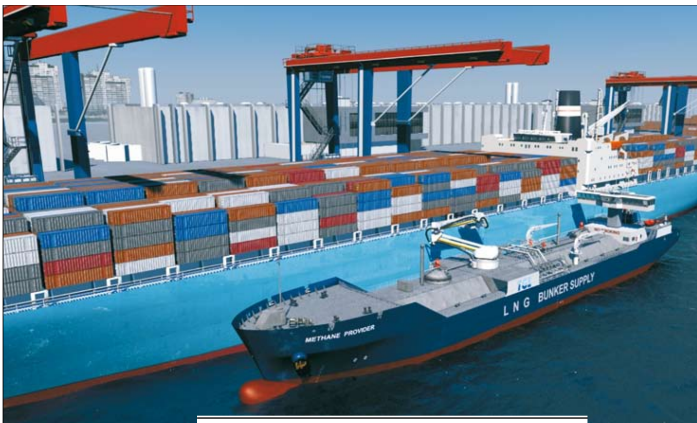
РИСУНОК 3. БУНКЕРОВКА СПГ «СУДНО – СУДНО»

и необходимым (потребляемым) объемом бункера СПГ.