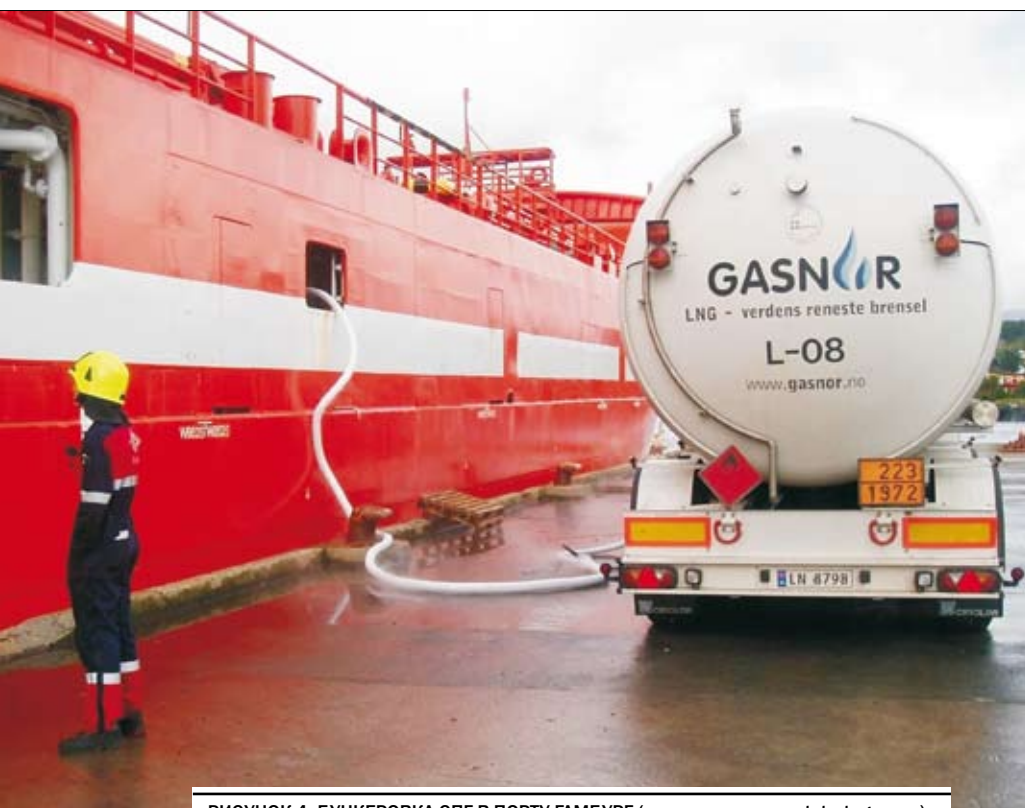
РИСУНОК 4. БУНКЕРОВКА СПГ В ПОРТУ ГАМБУРГ (источник: www.portstrategy.com)

• ледокольный буксир для работы в акватории порта Сабетта.