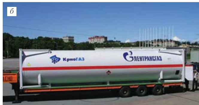
Емкости для хранения газа на судне: а) вкладные цистерны типа С (криогенный топливный танк вместимостью 125 м 3 (Chart Ferroх, Норвегия); б) контейнер-цистерны (контейнер-цистерна КЦМ-35/0,6, ОАО «Уралкриомаш»)

В 2022 году начинает действовать международное соглашение о придании Балтийскому морю статуса зоны особого контроля за выбросами окислов азота, и в соответствии с положениями конвенции МАРПОЛ статус района НЕСА предполагает, что все суда, построенные после 1 января 2022 года и эксплуатируемые в таком районе, должны иметь дизельные установки, отвечающие стандартам Уровня III.