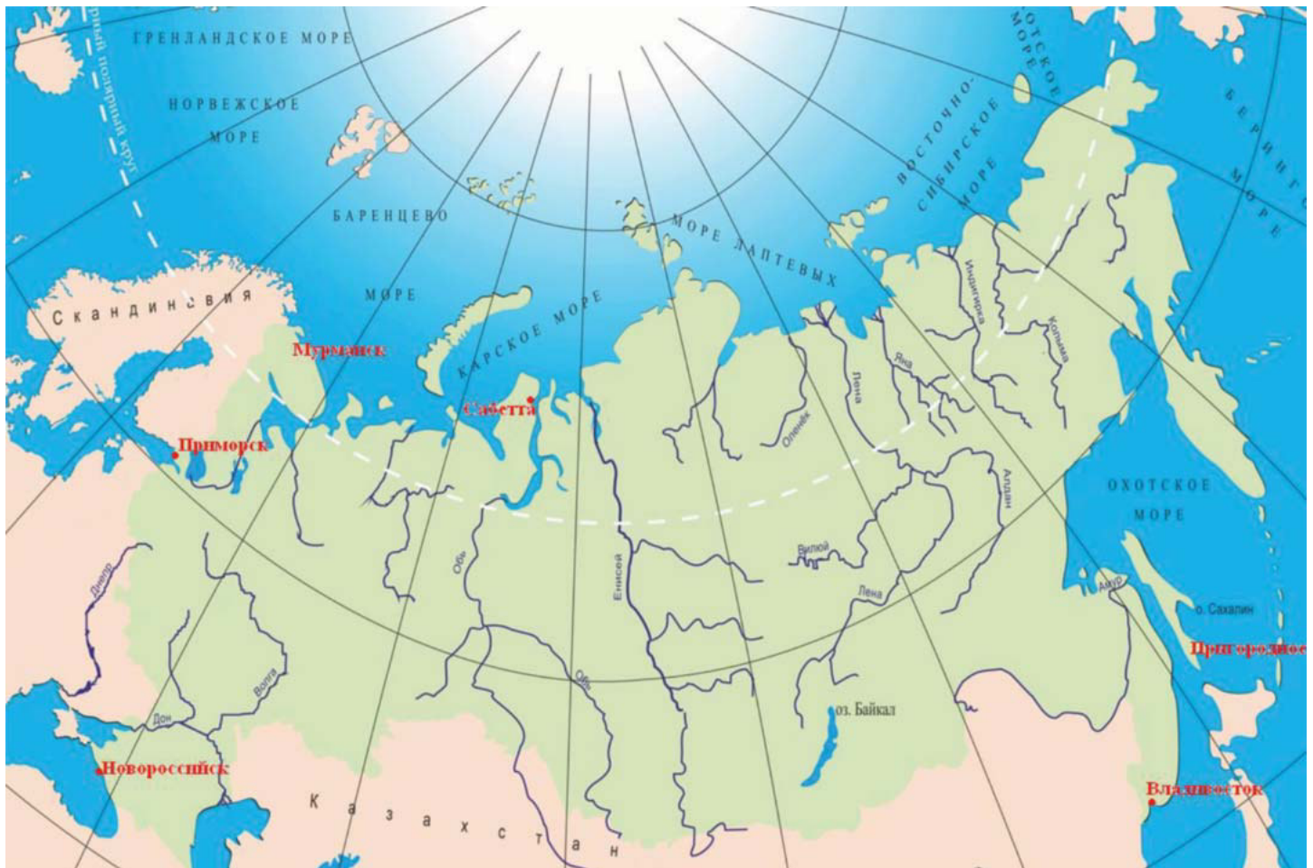
Предполагаемая схема размещения бункеровочных баз по морским бассейнам

Кроме того, целесообразно использование СПГ на судах обеспечения и ледокольных буксирах.